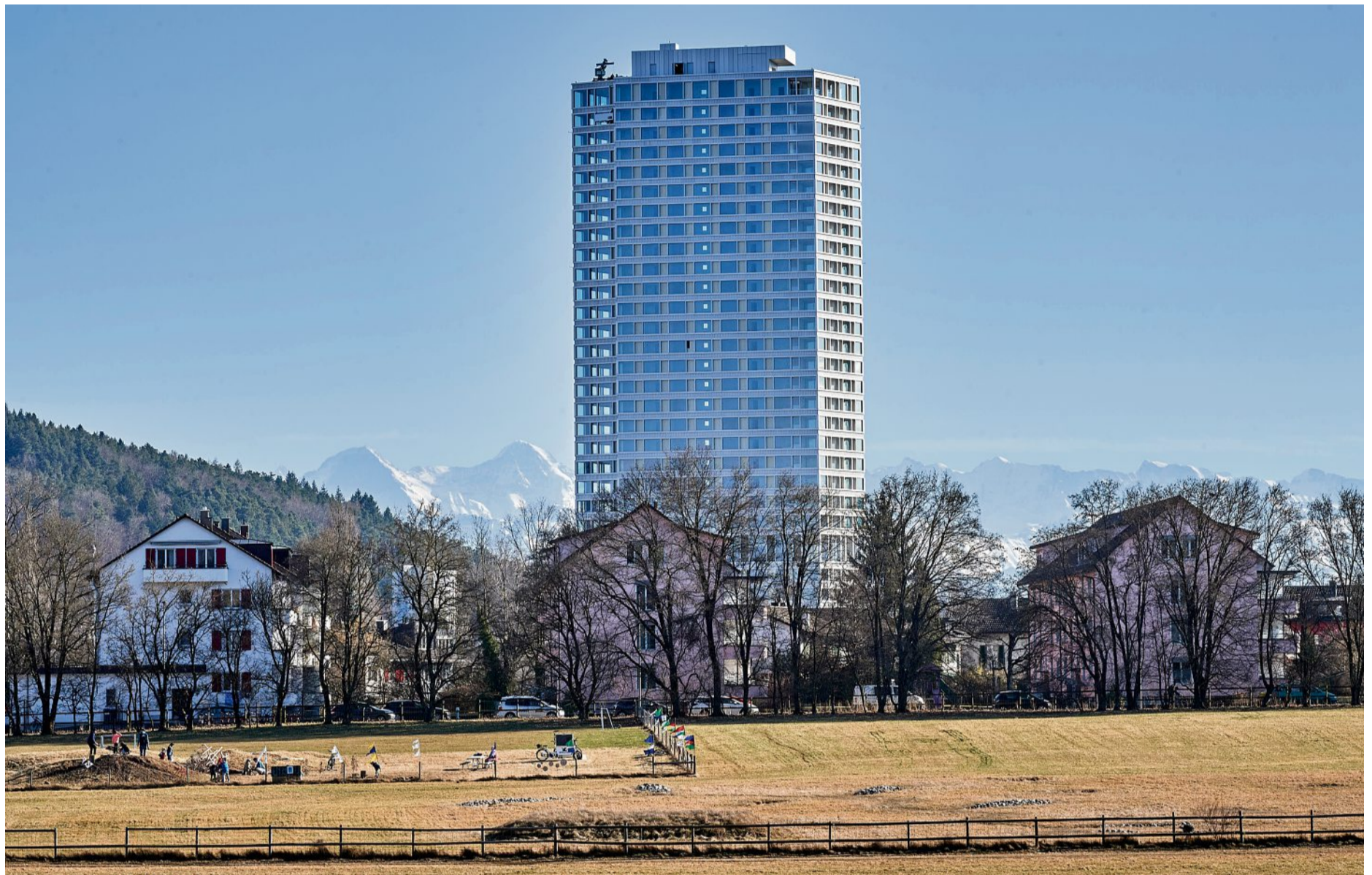
Der Baretower könnte bald Gesellschaft erhalten: Unweit des 100-Meter-Turms ist ein weiteres Hochhaus geplant.

Hier soll sich das Projekt in Ostermündigen abheben. Verwendet werde ausschliesslich regionales Massivholz. Dabei stamme nicht nur das Tragwerk aus Emmentaler Tannen, sondern auch alle Böden, Wände und Decken. Speziell ist zudem die Vorgehensweise beim Bau: Die einzelnen Holzelemente werden gewissermassen ineinander zusammengesteckt – mithilfe von Holzdübeln. «Für die Wandelemente werden weder Schrauben noch Leim verwendet.»