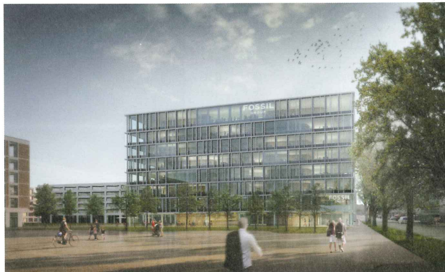
Europäischer Hauptsitz der Fossil Group in Basel, geplante Fertigstellung 2016.

Ein Pionierbau für die Alpen, Wellness Hostel 4000 & Aqua Allalin Saas-Fee. Faktor-Verlag.