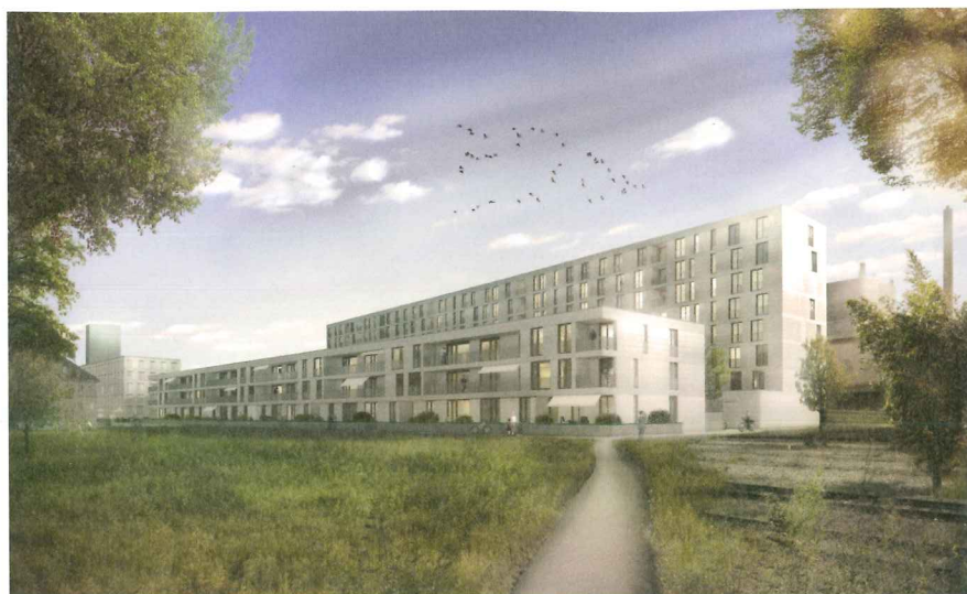
Wohnungsbau auf dem Baufeld G, Erlenmatt-Areal, Basel, geplante Fertigstellung Herbst 2015.

Areal räumlich neu definiert, stellt der Büro- bau mit seinen Erweiterungsbauten entlang dem Riehenring, die auch Wohnnutzungen ermöglichen, einen klassischen Stadtbaustein dar. Die Fassade des Kopfbaus ist mehrschicht- ig aufgebaut. Die innere Glasschicht mit un- durchsichtigen Brüstungsfeldern bildet einen homogenen Kubus. Dieser kommuniziert sei- ne innere Funktion nach aussen und macht die mehrschichtige Architektur des Gebäudes transparent. Die äussere Gebäudeschicht aus vertikalen und horizontalen Faserbetonele- menten strukturiert das Volumen in einer auf- gelösten Ordnung. Dies verstärkt die Präsenz und Kraft des Neubaus im städtischen Kon- text. Die Bauarbeiten haben begonnen; der Bezug ist auf Anfang 2016 geplant.