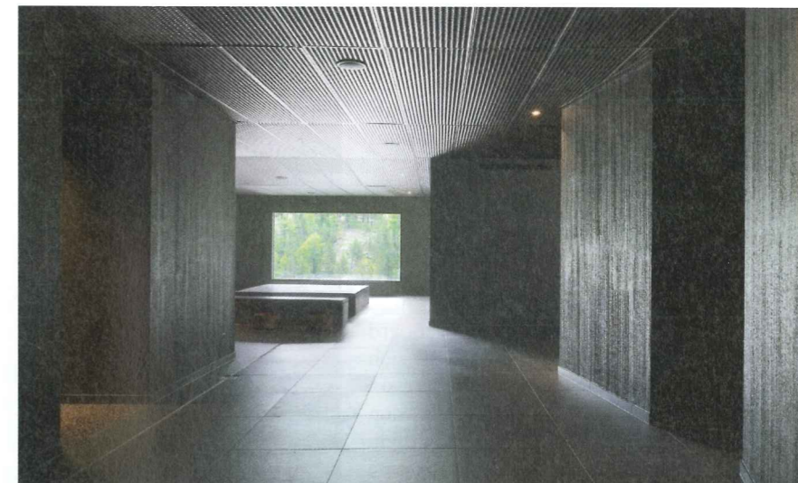
Wellnessbereich im Aqua Allalin in Saas-Fee, 2014.

Zwei Jahre nach dem gewonnenen Studienauftrag für das Baufeld G wurden Steinmann & Schmid mit dem Bau des neuen Europa-Hauptsitzes der Firma Fossil auf dem Erlenmatt-Areal beauftragt. Der achtgeschossige, 28 m hohe Bürobaubau besetzt eine städtebaulich prominente Lage am Riehenring, der nördlichen Einfallsachse der Stadt Basel. Im Kontext mit urbanen Platzgestaltungen und modernen Wohnbauten, die sich teilweise noch im Bau befinden, definiert der Neubau einen attraktiven städtischen Ort mit grosser Anziehungskraft. Während die Grossform der reinen Wohnüberbauung auf dem Baufeld G das Erlenmatt-