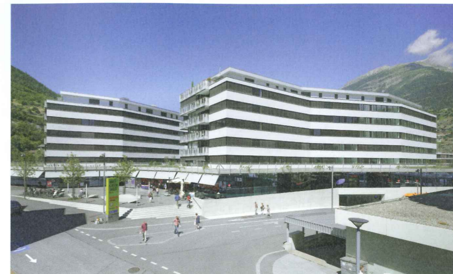
Wohn- und Geschäftshaus Brückenweg in Visp, 2013.

Mit der Erfahrung in städtebaulichen Entwicklungen konnte das Team auch bei zwei Grossprojekten auf dem Erlenmatt-Areal in Basel überzeugen. Die Entwicklung des Geländes des ehemaligen Deutschen Rangierbahnhofs begann vor 20 Jahren. Viele Rahmenbedingungen erschwerten die Vorgehensweise. Nach fast zehn Jahren politischer Abklärungen konnten mit dem Bebauungsplan die einzelnen Baufelder verkauft werden. Nach dem Verkauf begann erneut die Aufteilung. Der Gesamtentwickler Losinger Marazzi lud für das Baufeld G zu einem Studienauftrag ein. Steinmann & Schmid überzeugten mit einer einheitlichen, grossformati-