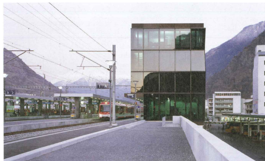
Bahnhof Visp, Aufnahmegebäude, 2013.

eines Masterplans, die Qualität und Verdichtung in den Gebieten nördlich des Bahnhofs voranzutreiben. Insbesondere in der Siedlungsentwicklung legt der Masterplan Massstäbe fest, die in einzelnen Quartierplänen weiterentwickelt werden können. Mit dem Neat-Ausbau standen im Wallis weitere Entwicklungen der Bahnhofsgebiete zur Diskussion, an denen sich das Büro mit seinen Erfahrungen beteiligen konnte. Für den Bahnhof Zermatt entwickelten sie nach dem gewonnenen Studienauftrag 2003 einen Masterplan, der jedoch aufgrund politischer Einflussfaktoren durch die Bahnen sistiert wurde. Auch am Studienauftrag für den Masterplan in Brig (2006) nahmen die Architekten teil, konnten sich aber nicht durchsetzen. Und vor kurzem präsentierten sie der Gemeinde Saas-Fee eine Evaluation der städtebaulichen Möglichkeiten im Gebiet zwischen Parkhaus und Post. Diese ist in der Auswertungsphase. Aber auch in Basel konnten sie ein wichtiges Verkehrsprojekt um-