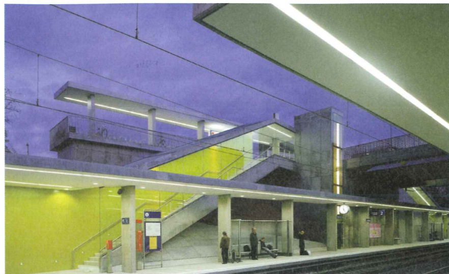
S-Bahn-Haltestelle Dreispitz in Basel, 2006.

Die durch Steinmann & Schmid eingeleiteten städtebaulichen Veränderungen gaben dem ehemals unbeachteten Quartier ein neues, städtisches Gesicht und schufen so ein attraktives Zentrum. Doch der städtebauliche Entwicklungsprozess ist nicht abgeschlossen. Seit 2013 verfolgt die Gemeinde Visp anhand