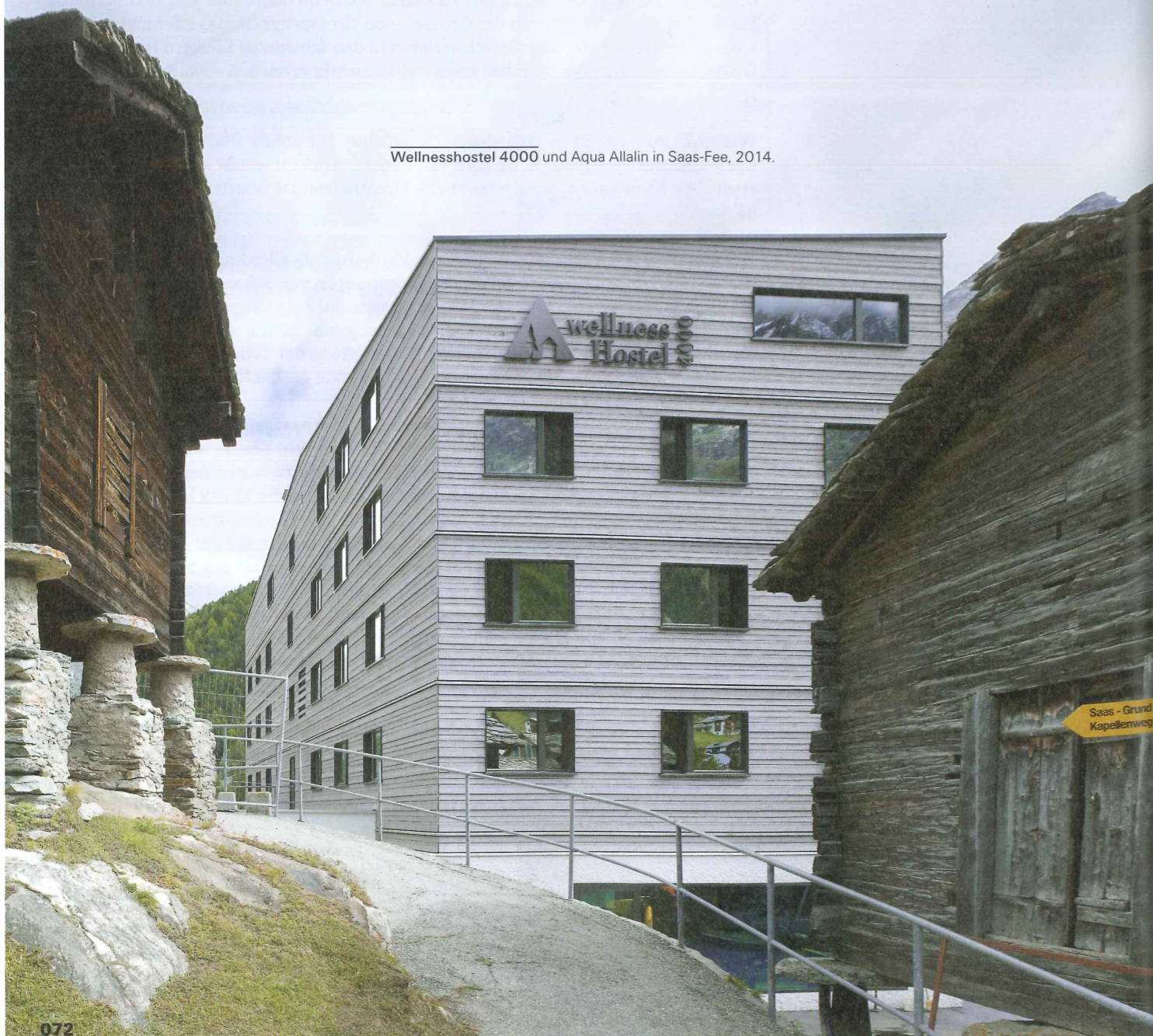
Wellnesshostel 4000 und Aqua Allalin in Saas-Fee, 2014.